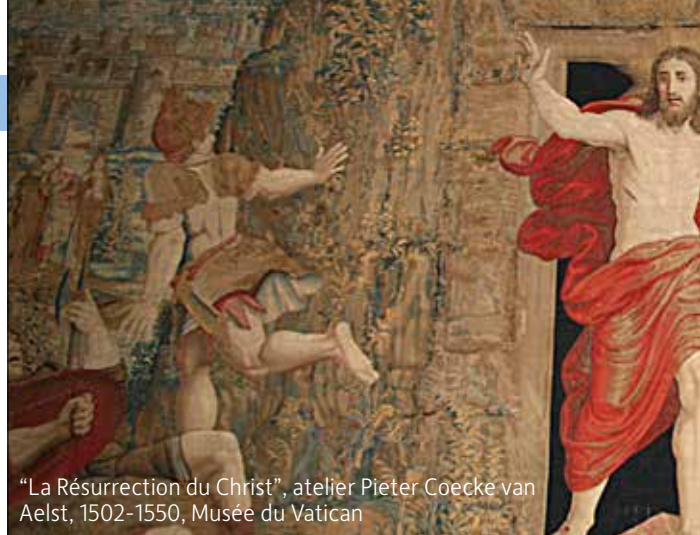
“La Résurrection du Christ”, atelier Pieter Coecke van Aelst, 1502-1550, Musée du Vatican

Dans les moments de douleur et de souffrance, la Résurrection du Christ brille comme un phare d'espérance. Elle nous rappelle que même dans les ténèbres les plus profondes, la lumière de la vie éternelle brille toujours. Comme l'écrivit l'apôtre Pierre dans sa première lettre, « Béni soit Dieu, le Père de notre Seigneur Jésus Christ : dans sa grande miséricorde, il nous a fait renaître pour une vivante espérance grâce à la Résurrection de Jésus Christ d'entre les morts. (...) Aussi vous exultez de joie, même s'il faut que vous soyez affligés, pour un peu de temps encore, par toutes sortes d'épreuves. » (1 Pierre 1,3.6). Cette espérance n'est pas naïve, elle ne nous épargne pas la souffrance : le Christ lui-même ne se l'est pas épargnée, contrairement à ce qu'avançaient certaines hérésies des premiers siècles, qui pensaient que la Passion était